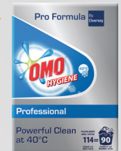
OMO HYGIENE VOLLWASCHMITTEL