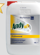
ANDY PROFESSIONAL ALLZWECKREINIGER