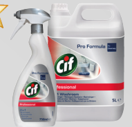
CIF PROFESSIONAL 2IN1 BADREINIGER