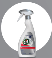
CIF PROFESSIONAL BADREINIGER