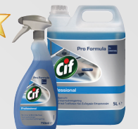
CIF PROFESSIONAL GLAS & FLÄCHEN