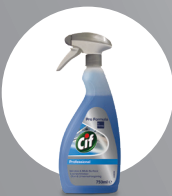
CIF PROFESSIONAL GLAS & FLÄCHEN