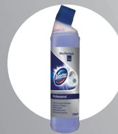
DOMESTOS PROFESSIONAL WC-REINIGER