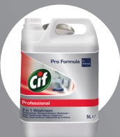
CIF PROFESSIONAL BADREINIGER