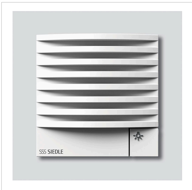
Bus-Türlautsprecher-Modul Plus BTLM 651-0 W 210007339-00